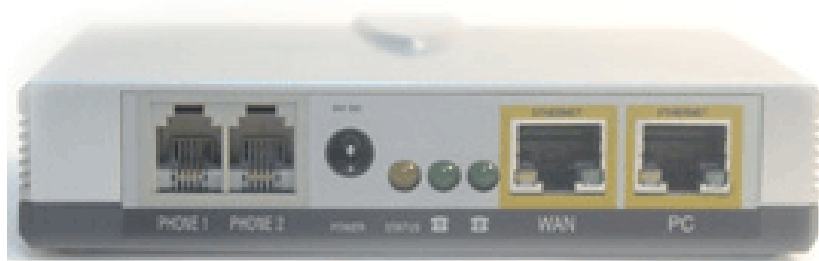
Obrázek č. 1 - zadní strana adaptéru SPA - 2102

Nyní můžete připojit napájecí trafo adaptéru do elektrické sítě a zapnout všechna připojená zařízení.